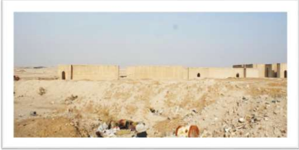
صورت بتاريخ ٢٠١٦/١٠/٢٠ صورة (٢) مسجد البصرة القديم (الخطوة)