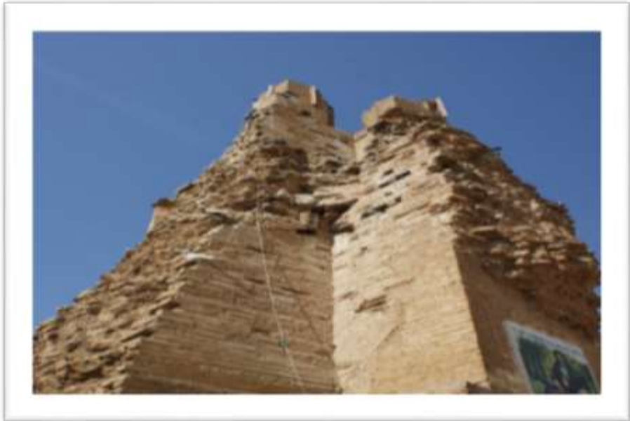
المصدر: الدراسة الميدانية، صورت بتاريخ ٢٠١٦/١٠/٢٠